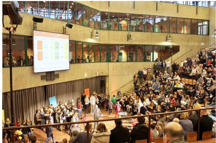
Eine Menge Bewegung im Forum bei der Verteilung der Schülergruppen nach Farben.

Stimmung im Hause haben. So haben es uns auch Eltern gespiegelt, die schon ein oder mehrere Kinder auf unserer Schule haben, sie sagten, dass wir uns so dargestellt haben, wie wir sind.“ Nicht nur die von