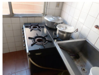
Der Herd des Anstoßes – bald kann in Maria e Marta wieder lecker gekocht werden!

reifte spätestens nun der Gedanke bei allen Beteiligten, diese Hilfestellungen mit der Fortsetzung des Austauschprogrammes unserer Schule mit der Corcovado-Schule in Rio de Janeiro weiter fortzuführen und, wenn möglich, sogar noch auszubauen.