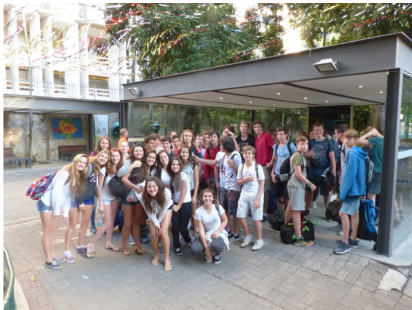
Alle Austauschschüler 2015/16 auf einen Blick

Die Berichterstattung in den vergangenen Tagen über die brasilianische Metropole und Gastgeber-Stadt der Olympischen Spiele 2016, Rio de Janeiro, ist ebenso umfassend wie facettenreich und auch kritisch gewesen. Unsere Schule hat dabei einen besonderen Blick auf die Stadt an der Copacabana gerichtet, weil in diesem Sommer 24 Schülerinnen und Schüler der 8. Klassen für drei Wochen in Brasilien weilten, um ihre Austauschschüler/-innen an der Corcovado-Schule im vorolympischen Rio zu besuchen und im Anschluss daran einige weitere Tage im Landesinneren, in Prados im Bundesstaat Minas Gerais, zu verbringen, um das südamerikanische Land und seine Menschen noch intensiver kennen zu lernen. Neben vielen faszinierenden Dingen und Erfahrungen, die Rio und Minas Gerais zu bieten haben, so bleiben